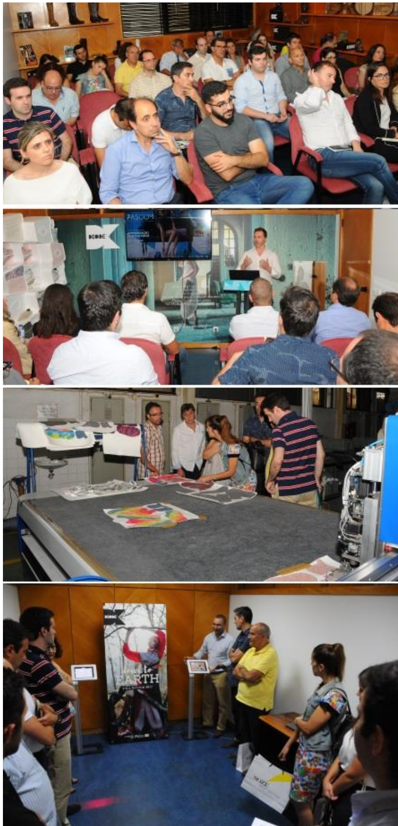
Ação de demonstração e apresentação resultados do projeto de IDT FASCOM-Fashion cognizant manufacturing- na Fábrica de calçado SOZÉ, 26 de julho 2017

UNIÃO EUROPEIA Fundo Europeu de Desenvolvimento Regional